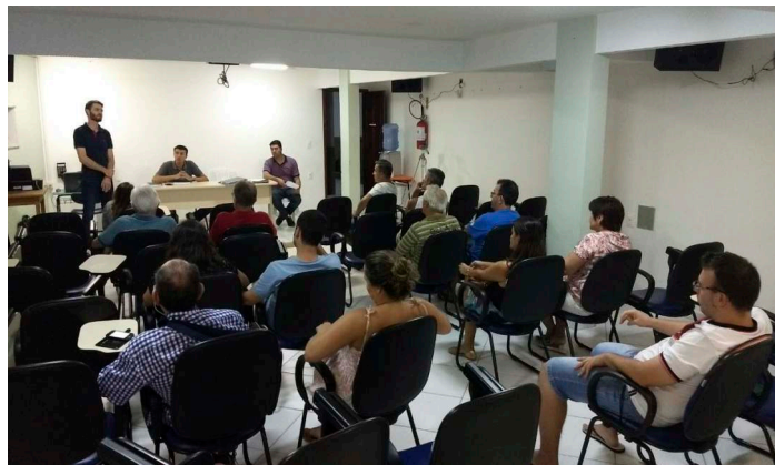
Reunião Comunitária Paróquia São Judas Tadeu

somente assim construiremos a Cidade que desejamos, para nós mesmos e às futuras gerações.